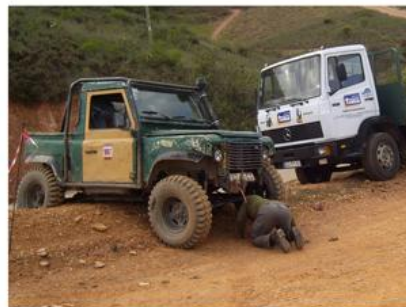
Foto 1 - VIII Raid BTT Rota dos Pinheiros - Troféu BTT Ourém.